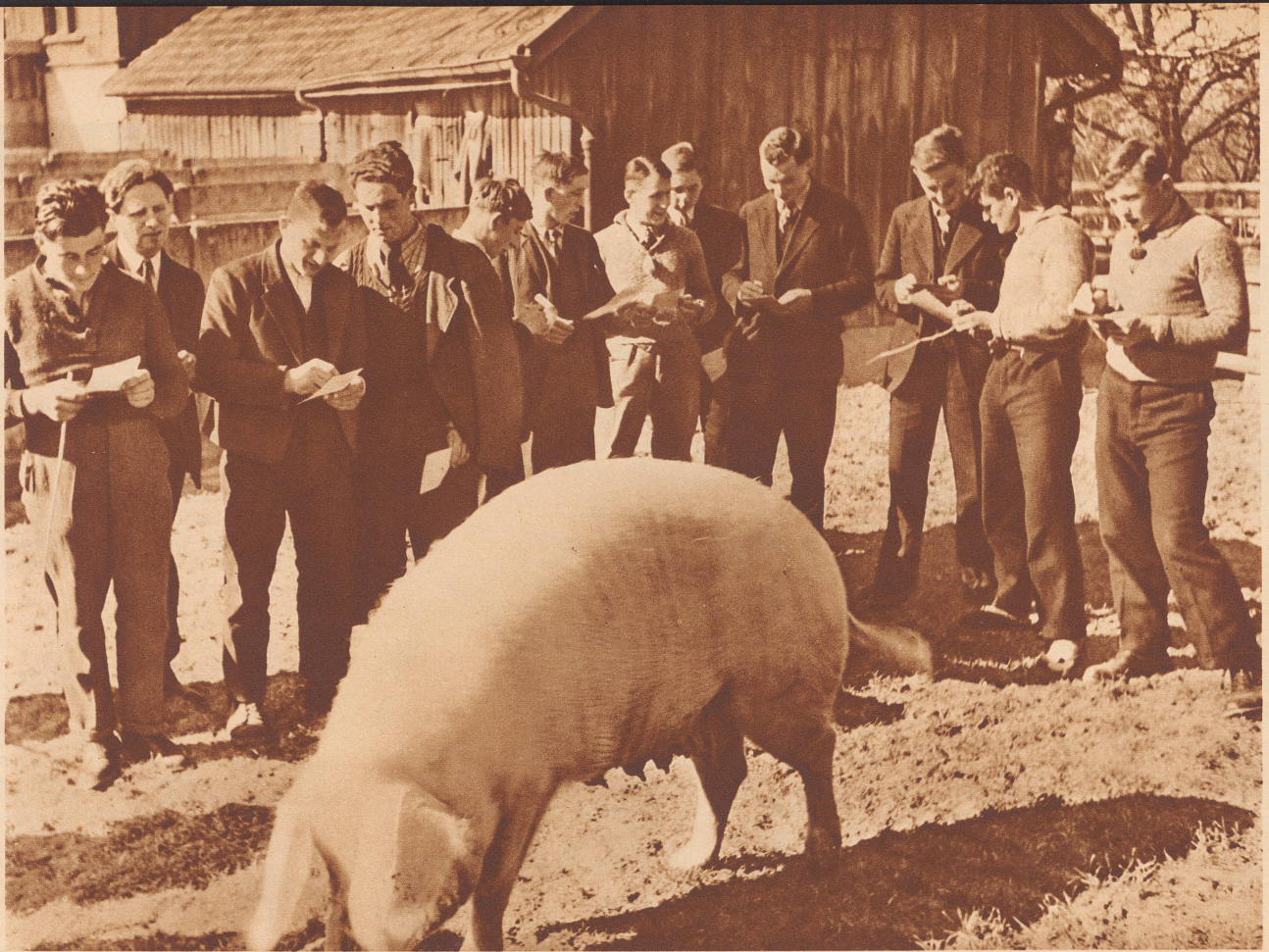
Im Examen. Examen in der landwirtschaftlichen Schule Strickhof, Zürich. Die Prüfungen erstrecken sich über sämtliche Zweige der Landwirtschaft: Ackerbau, Baumpflege und Weinbau, Zuchtviehpflege, Milchwirtschaft usw. Es ist für das Land von großer Wichtigkeit, in der Landwirtschaft viel gut vorbereitete und mit Kenntnissen ausgerüstete Leute zu haben, die auch aus einem kleinen Heimwesen das Beste zu ziehen vermögen. Bild: Die Prüflinge beurteilen ein Zuchtschwein. Das abgegebene Urteil wird hinwiederum zum Urteil über sie selber. Un examen à l'Ecole d'agriculture zurichoise de Strickhof. Cet examen comporte toutes les branches de l'agriculture. Notre photo montre les candidats critiquant une truie. Comme ils jugent ... ils seront jugés !