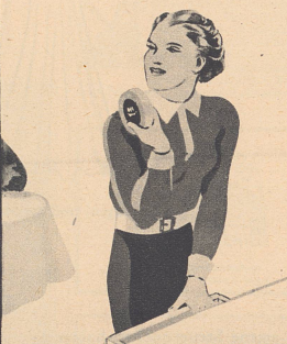
„Ja, ja, die ändern! Vergiß Du das nächste Mal nicht, Deine Gaba mitzunehmen, dann brauchst ihr nicht auf das Rauchen zu verzichten und bleibt doch gut bei Stimme.“