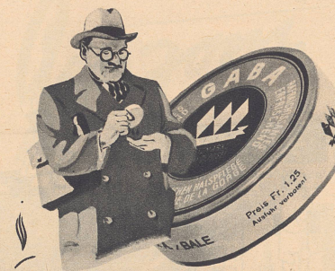
Gaba beugt dem lästigen Raucherkatarrh vor und schützt vor Husten und Heiserkeit.