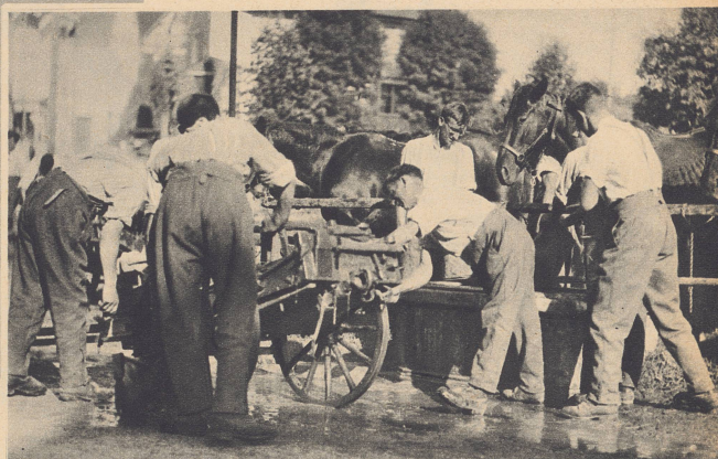
Der innere Dienst macht alles rein und blank: Waffen, Ausrüstung, Kleider, Fuhrwerke, Pferd und Mann.

Aus Kleinem baut sich das Große auf. Eine Sache wird stark durch die Zuverlässigkeit ihrer geringen Teile. Der gewaltige Organismus eines Heeres schöpft seine Kraft aus der Sorgfalt, mit der im Einzelnen gearbeitet wird. An der Sorgfalt des innern Dienstes erkennt man den wahren Gehalt einer Truppe. Wer im Geringen treu ist, versagt schwerlich im Großen. Kleine Nachlässigkeiten führen zu unabsehbaren Konsequenzen: ein Eisen, das zur Unzeit locker wird, kann wichtigste Maßnahmen verzögern, eine schlecht unterhaltene Waffe kann durch ihr Versagen ein Gefecht entscheiden. Zur blanken Waffe und sauberen Ausrüstung gehört ein gut aussehender Mann. Die wallenden Locken sind wenig soldatisch, und der Stachelbart macht den Krieger nicht. Auch in diesem Betracht hält die gute Truppe auf ihr Aussehen.