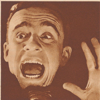
Schrecksekunde (z.B. im Automobilverkehr) die Nerven entscheiden!