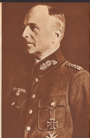
General der Artillerie Walter von Brauchitsch bisher Kommandant der Heeresgruppe 4, wurde zum Oberbefehlshaber des Heeres ernannt. Le colonel-général Walter von Brauchitsch, nouveau généralissime de l'armée du Reich.

A Nuremberg, il y a trois ans. Le Führer et chancelier Adolf Hitler échange un cordial salut avec le ministre de la Reichswehr von Blomberg. Le maréchal von Blomberg vient récemment de quitter son poste de ministre de la guerre. Le commandement suprême de l'armée est aujourd'hui assuré par le Führer. Le parti commande l'Etat et l'armée.