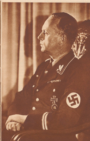
J. von Ribbentrop

bisher Reichsminister des Auswärtigen, ist zum Präsidenten des neugebildeten Geheimen Kabinettsrates ernannt worden. Le Baron von Neurath, jusqu'ici ministre des Affaires étrangères, est nommé président du conseil du cabinet secret du Führer récemment créé.