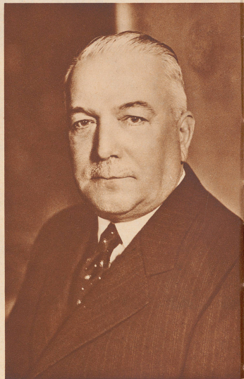
Freiherr von Neurath

bisher Reichsminister des Auswärtigen, ist zum Präsidenten des neugebildeten Geheimen Kabinettsrates ernannt worden. Le Baron von Neurath, jusqu'ici ministre des Affaires étrangères, est nommé président du conseil du cabinet secret du Führer récemment créé.