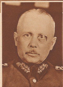
Generaloberst von Fritsch

der Oberbefehlshaber des Heeres, ist von seinem Posten zurückgetreten. Le colonel-général von Fritsch, chef du haut commandement de l'armée, démissionnaire pour raisons de santé.