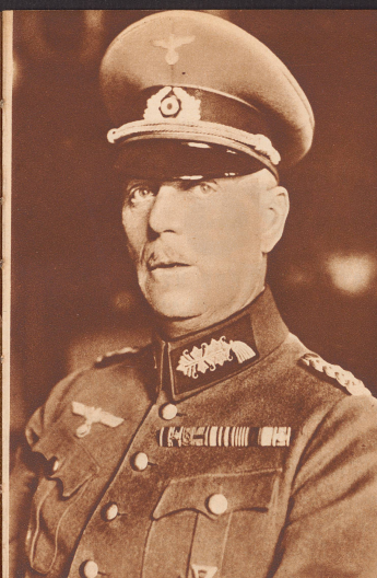
General der Artillerie Wilhelm Keitel bisher Chef des Wehrmachtsamtes, wurde zum Chef des Oberkommandos der Wehrmacht ernannt. Le général d'artillerie Wilhelm Keitel qui succède au colonel-général von Fritsch comme chef du haut commandement de la force armée.