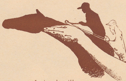
Le jeu des silhouettes.