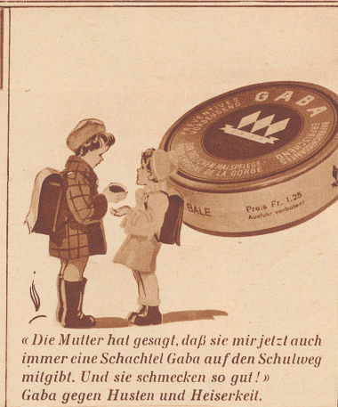
«Die Mutter hat gesagt, daß sie mir jetzt auch immer eine Schachtel Gaba auf den Schulweg mitgibt. Und sie schmecken so gut!» Gaba gegen Husten und Heiserkeit.