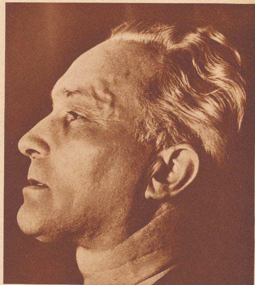
Der Schweizer Schauspieler und Rezitator Otto Bosshard

der zur Zeit mit seinen Dramen-Vortrags- abenden seine Zuhörer in den Schweizer Städten begeistert und hinreißt.