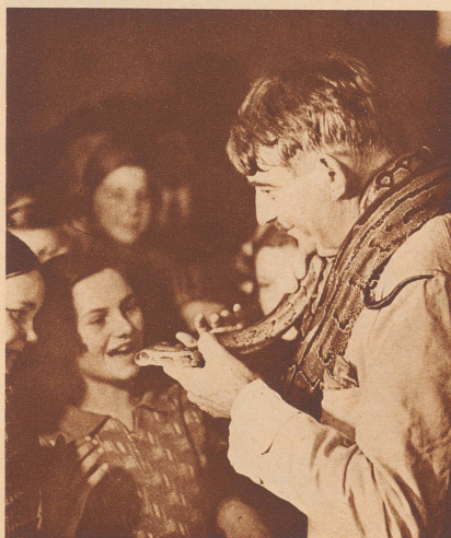
Aufnahmen von einer Schlangenvorführung in Adliswil