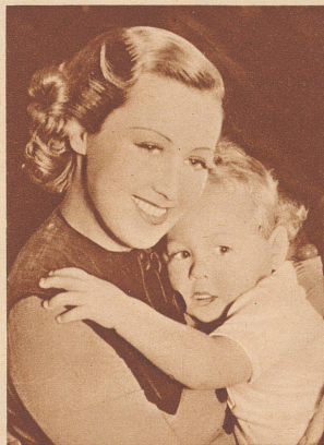
Joan Blondell and her Son Warner Brothers Star appearing in "The perfect Specimen"

IRIUM gibt Ihren Zähnen wieder strahlenden Glanz