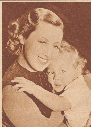
Jean Blondell and her Son Warner Brothers Star appearing in "The perfect Specimen"

GENERALVERTRETER: BLATTNER & CO., BASEL 2