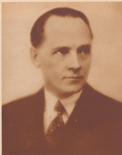
Guy de Pourtales

Er trat hinter die Rubia, die noch immer in ihre Patience vertieft war. Drei von den Königen waren freigemacht, und zwei Asse warteten auf die folgenden Züge Herz-Aß auf die Drei. Karo-Aß auf die Vier.