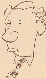
Ragosin Rudland «Aus Sachovny Tyden»

1. d4 d5, 2. c4 c6, 3. Sf3 Sf6, 4. e3 Lf5, 5. Ld3 e6, 6. Sc3 dxc6, 7. Lxc4 Lb4, 8. Db3 De7, 9. 0—0 0—0, 10. a3 Lxc3, 11. bxc3, De7, 12. Se5 Sbd7, 13. SXS SXS, 14. f3 b5, 15. Le2 c5, 16. a4 Le6, 17. Dd1 Tfd8, 18. axb, cxb, 19. Lxb5 Dxc3, 20. Ld2 De7, 21. Tc1 Db6, 22. Da4 Tab8, 23. La5 Dd6, 24. Lc7 De7, 25. d5 Sc5, 26. Lxd8, Txl, 27. Da3 Txd5, 28. e4 Td2, 29. Dxc5 Dg5, 30. Tf2 Td8, 31. f4 Df6, 32. Dxc5 De7, 33. f5 Da3, 34. De7 Tc8, 35. DXT+. Schwarz gibt auf.