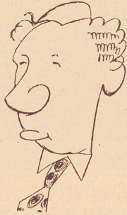
Ragosin Rudland «Aus Sachovy Tyden»

1. d4 Sf6, 2. e4 e6, 3. Sf3 d5, 4. Lg5 Sbd7, 5. Sc3 Le7, 6. e3 0—0, 7. Tc1 e6, 8. Ld3 h6, 9. Lh4 dxc, 10. Lxc4 b5, 11. Ld3 a6, 12. 0—0 e5, 13. a4 e4, 14. Lb1 Sd5, 15. Dc2 g6, 16. Lxc7 Dxc7, 17. e4 Sxc3, 18. Dxc3 Lb7, 19. Da5 Tfc8, 20. b3 Sf6, 21. bxc Sxc4, 22. axb Sd6, 23. bxa Txa6, 24. Dd2 Sxc4, 25. DXh6 Lxf3, 26. gxf3 Df6, 27. Le4 Ta5, 28. Tc2 Tg5+, 29. Kh1 Th5, 30. Dc1 Dh4, 31. Weiß gibt auf.