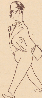
Capablanca Kuba «Aus Sachovy Tyden»

1. d4 d5, 2. c4 c6, 3. Sf3 Sf6, 4. Sc3 dxc4, 5. a4 Lf5, 6. e3 e6, 7. Lxc4 Lb4, 8. 0—0 0—0, 9. Db3 De7, 10. Se5 c5, 11. Sa2 La5, 12. Db5 b6, 13. f3 c5xd4, 14. e4 Lg6, 15. Lg5 a6, 16. Db3 Dc5, 17. Lxf6 gxf6, 18. Sd3 Dd6, 19. Dd1 Tfc8, 20. b3 Sd7, 21. Dd2 Se5, 22. Sxc5 Dxc5, 23. Ld3 f5, 24. Tab1 fxe4, 25. fxe4 Lc3, 26. b4 De5, 27. Sc1 a5, 28. bxa Lxa5, 29. Tb5 Tc5, 30. Df3 Txb5, 31. axb5 Ld2, 32. Se2 Le3+, 33. Kh1 Ta3, 34. Td1 h5, 35. h3 Txd3, 36. Txd3 Lxe4, 37. Txc3 dxc3, 38. Df1 Dxb5, 39. Df4 Lxg2, 40. Kh2 Dxc2. Weiß gibt auf.