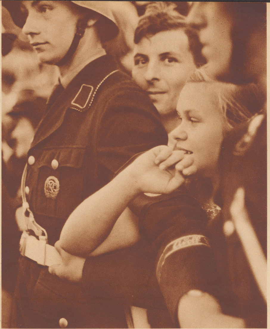
Das kleine Mädchen hinter den Soldaten der Leibstandarte Hitlers bei der Absperrung am Bahnhof Heerstraße, wo Mussolini aus dem Sonderzug stieg.

Quelle joie exprime les yeux de cette jeune spectatrice.