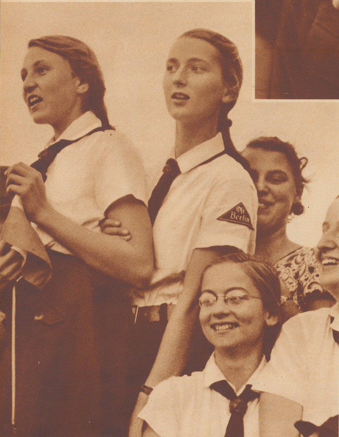
Das Entzücken: Berliner Mädchen, Angehörige der großen Organisation des B. d. M. (Bund deutscher Mädchen) sehen Hitler und Mussolini in ihren Wagen steigen

Ce que désigne au Duce cet officier d'ordonnance ! La direction de l'ax Berlin-Rome probablement.