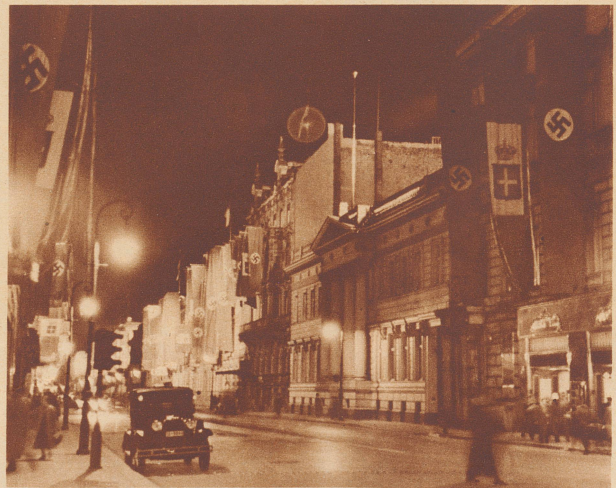
Die Ausnahme. Deutsche und italienische Flaggen hingen in unvorstellbaren Mengen überall da von den Gebäuden herunter, wo die beiden Diktatoren durchkamen, nur das Gebäude der britischen Botschaft an der Wilhelmstraße blieb kahl, ebenso war's mit dem der russischen Botschaft.

Quelle joie exprime les yeux de cette jeune spectatrice.