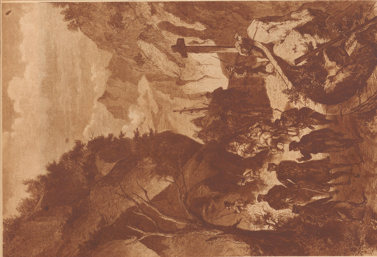
Seit den 30er Jahren des 19. Jahrhunderts leidet Spanien unter periodisch aufflackernden Bruderkriegen, deren Ursprung auf einen richtigen Zwiss unter Brüdern zurückgeht. Nach dem Bruder König Ferdinand VII., Don Carlos, der die Reaktionen um sich scharte und sich gegen die Regierung erhob, nannte man die Aufständischen Jahrezehnte hindurch «Carlisten». Im Jahre 1873 kam es wieder einmal zu einer heftigen Aufständischen Bewegung mit vielen Greuelthaten auf beiden Seiten. Lange wußten sich die Carlisten in den Schluchten der Pyrenäen unserem Bild nach einem eben erfolgigen Schmutzweil von einem Bauern den Weg zur nächsten Ortschaft weisen. Mit schubereiten Wägen durchdröhnen die Verunsicherten den Soldaten die Hänge über und unter der Pyrenäenstraße. Diese Bauern machen zu gerne mit den Carlisten gemeinsame Sache. Kann man darum dem Führer trauen?

Les tranchées des gouvernementaux dans la cité universitaire de Madrid sont établies comme si la guerre devait durer plusieurs années encore. A l'arrière plan, on aperçoit le bâtiment de la faculté de philosophie ébranlé par les obus. A 120 m. de là, dans des positions également isolées, se tiennent les troupes de Franco.