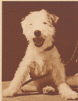
«Zetti», unser großer erster Preis

abgeschickt haben müßt. Nach diesem Tage wird der Unggle Redakter hartherzig und er nimmt keine Zeichnungen mehr an, auch wenn sie noch so schön sind. Vergeßt auch die Adresse nicht, die ihr aufs Kuvert schreiben sollt: Redaktion der ZI, Morgartenstraße 29, Zürich (und oben in einer Ecke das Wort «Zeichnungswettbewerb»).