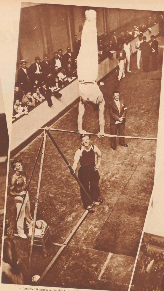
Ein finnischer Kunstturner in der freigeübten Übung am Reck. Un concurrent finnois dans l'exercice libre au reek.