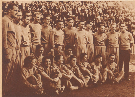
Die Schweizer Satus-Delegation. — La délégation suisse.