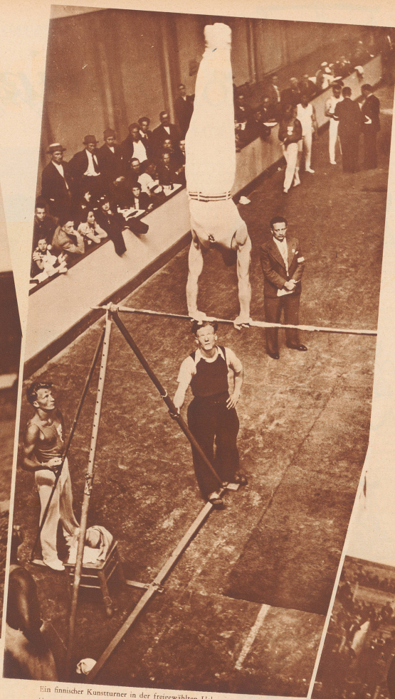
Ein finnischer Kunstturner in der freigeübten Übung am Reck. Un concurrent finlandais dans l'exercice libre aureck.