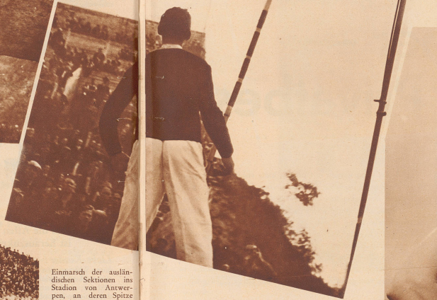
Kein Mensch in Europa springt höher als dieser russische Sportprofessor Osola aus Moskau. Bei diesem Sprung in Antwerpen stand die Latte auf 4,20 Meter. In seiner Heimat hat er es schon auf 4,45 Meter gebracht.