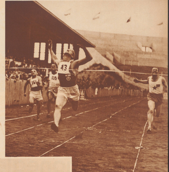
Der spannende Endspurt im 100 Meter-Lauf, den der Finne Hansen in der Zeit von 10,9 Sekunden gewann. La finale du 100 mètres que remporta le Finlandais Hansen en 10,9 secondes.