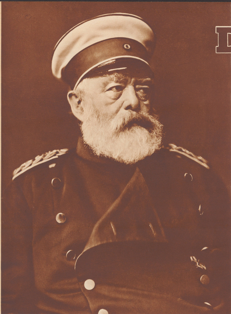
Fürst Otto von Bismarck (1815–1898) im Alter von 68 Jahren. Le prince Otto von Bismarck (1815–1898) à l'âge de 68 ans.