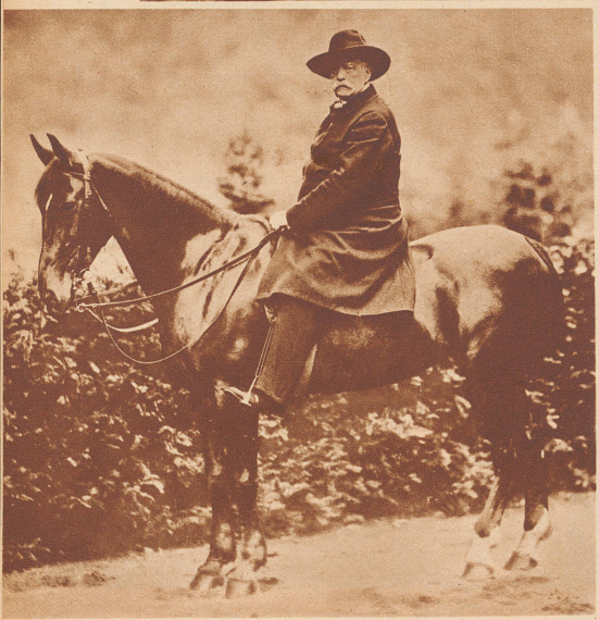
Der 75jährige Bismarck nach seiner Entlassung aus dem Kanzleramt im Jahre 1890 bei einem Spazierritt im Park von Friedrichsruh.

der demokratisch-politischen Ideen unterschätzt, aber ebenso die materielle und politische Forderung, die auf das Ganze, nicht auf eine Unterstützung ging. Aber seine Teilreform brachte einen bleibenden und großen sozialen Gewinn... Der junge Kaiser Wilhelm II. bekundete Bismarck gegenüber nicht mehr jene teils einsichtige, teils duldende Nachgiebigkeit wie sein Großvater Wilhelm I. Es kam zum Konflikt und Bismarck zog sich im Jahre 1890 aus der Politik zurück.