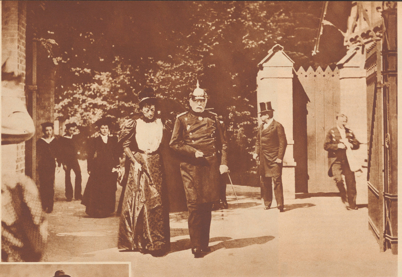
Fürst Bismarck bei einem Spaziergang mit der Großherzogin von Mecklenburg im Juni 1895 vor dem Gartenportal des Schlosses Friedrichsruh. Das Bild dokumentiert das Ende eines alten Haders. Der damalige Herzog von Mecklenburg, Friedrich Wilhelm, war nämlich der Neugestaltung Deutschlands und dem dafür verantwortlichen Mann nicht gewogen. Erst nach Bismarcks Rücktritt vom Amt kam es zu einer persönlichen Versöhnung zwischen dem Hause Mecklenburg und dem alten Herrn auf Friedrichsruh.

Le prince Bismarck en promenade avec la Grande-Duchesse de Mecklembourg dans les jardins de Friedrichsruh. Cette photographie est le témoignage d'une réconciliation. De fait, tant que Bismarck fut au pouvoir, le Grand-Duc de Mecklembourg ne cessa de critiquer sa politique d'une Allemagne confédérée, mais après sa chute il se rapprocha du Chancelier de fer.