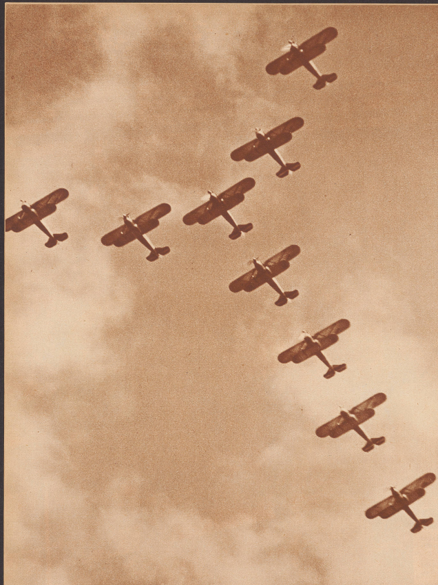
Geometrie im Luftraum. Ein wundervolles Detail aus dem schwungvoll durchgeführten Programm der italienischen Neuner-Staffel unter Anführung von Hauptmann Aldo Remondino. Geométrie dans l'espace. L'une des remarquables formations de l'escadrille italienne sous la conduite du Capitaine Aldo Remondino.