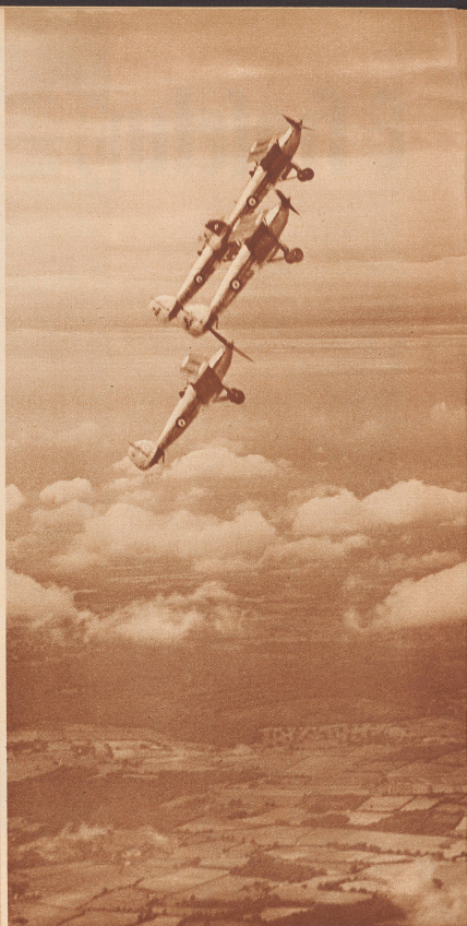
Die englische Kunstflugstaffel, die im Laufe dieser Woche in Dübendorf eingetroffen ist. Sie besteht aus vier Akrobatik-Maschinen und steht unter der Führung von Commander C. W. Hill. Die Kunst dieser berühmten Staffel wird am Samstag und Sonntag in Dübendorf zu sehen sein. La splendide escadrille anglaise d'acrobatie qui, sous la conduite du Commandant C. W. Hill, se produira samedi et dimanche prochain à Dübendorf.