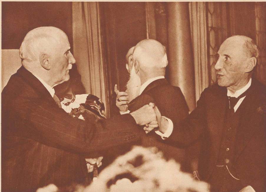
Alt Bundesrat Dr. Felix Ludwig Calonder