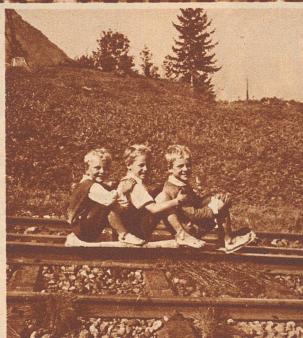
Die drei Buben rutschen sichtlich vernügt auf der Zahnradschiene nach Goldau.