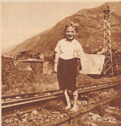
Der Konstrukteur trägt die Bahn – Schaufel und aufgenagelte Bretter – bergwärts. Die Buben hüten sich wohlweislich, ihr Patent anzumelden.