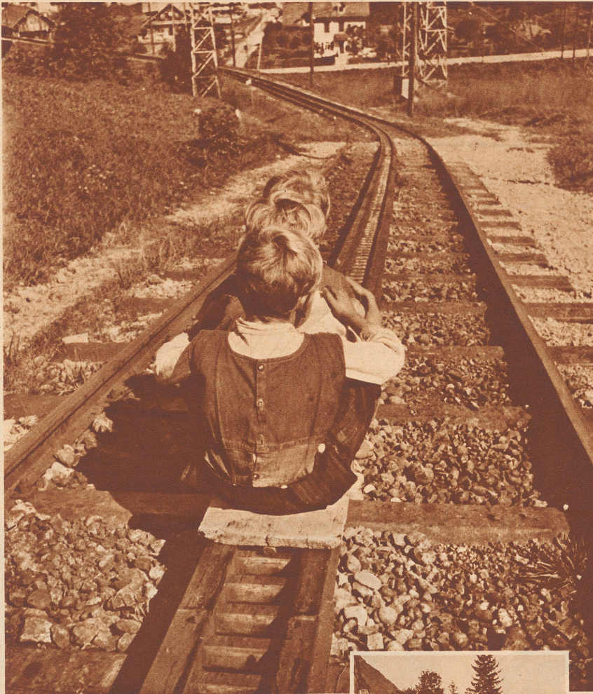
Fest aneinandergeschmiegt sausen die drei Knirpse auf ihrer «Rigibahn» zu Tal.