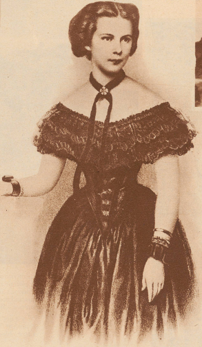
Kaiserin Elisabeth von Oesterreich (1837—1898). Sie war eine hochgebildete, literarisch und künstlerisch sehr bewanderte Persönlichkeit. Von der Politik hielt sie sich fern. L'Impératrice Elisabeth d'Autriche (1837—1898). Très cultivée et douée pour les arts et les lettres, elle se tint cependant toujours à l'écart de la politique.