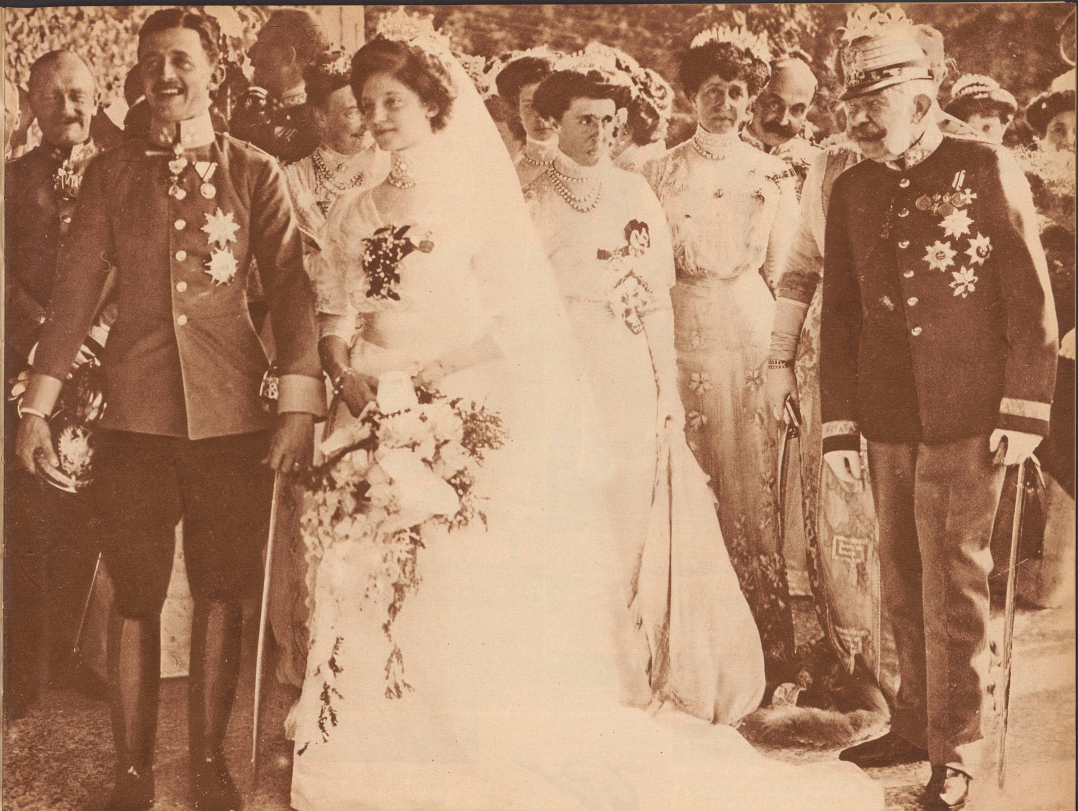
Kaiser Franz Joseph an der Hochzeit seines Großneffen Karl mit Zita, des spätern Kaiserpaars, drei Jahre vor Ausbruch des Weltkrieges. L'Empereur François-Joseph assistant au mariage de ses petits-neveux Charles et Zita — le futur couple impérial — trois ans avant le début de la guerre mondiale.