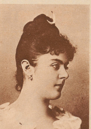
Die 17jährige Baronesse Marie Vettera, die zusammen mit dem Kronprinzen Rudolf in den Tod ging. La Baronne Marie Vettera à l'âge de 17 ans. Amie de l'Archiduc-héritier Rodolphe, elle trouva la mort avec lui à Meyerling.