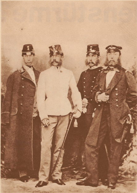
Kaiser Franz Joseph und seine Brüder im Jahre 1862. Von links nach rechts: Erzherzog Ludwig Viktor, Franz Joseph, Erzherzog Karl Ludwig, Erzherzog Maximilian, der spätere Kaiser von Mexiko.