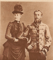
Kronprinz Erzherzog Rudolf und seine Gemahlin, Prinzessin Stephanie von Bulgarien. Die Ehe war unglücklich. Aus dem Chaos der sich daraus ergebenden Konflikte wußte sich Rudolf nur durch Selbstmord zu retten.

Interessen» gab. In Wirklichkeit kümmerte er sich um die Dynastie herzlich wenig, trieb er doch die fähigsten Mitglieder seiner Familie in die Opposition. Zeitweilen blieb er am Kleinen haften. Fragen des militärischen Drills, Einzelheiten der Aufrüstung z. B. interessierten ihn mehr als die großen Zusammenhänge der zeitgenössischen Entwicklungserscheinungen. Seine Völker sahen mit einer Verehrung zu ihm auf, die in keinem Verhältnis zu seiner staatsmännischen Begabung stand; aber das gehäufte Leid, das dieser alte Mann, nicht Geringes davon durch eigene Schuld, vom Schicksal aufgebürdet bekam, steigerte seine Volkstüchtigkeit, verband ihn mit den Massen seines Volkes, deren Mitleid sich zur Verehrung wandelte; standhaft und gottgegeben hatte er die mancherlei Schläge ertragen; die Niederlage im Kriege und die Tragödien in seiner Familie. Abgesehen von dem gewaltamen Tode seines nächsten Bruders, des Kaisers Maximilian von Mexiko (1867) entfiel ihm das Geschick den einzigen Sohn und die Gattin auf tragische Art. Kronprinz Rudolf erkrankte durch eigene Hand am 30. Januar 1898 und die Kaiserin Elisabeth fiel Anfang September des Jahres 1898 in Genf dem Dolche des italienischen Anarchisten Lucheni zum Opfer. Der über 50jährige Kaiser mußte noch den Ausbruch des Weltkrieges erleben. 1916 starb Franz Joseph I. 86jährig.