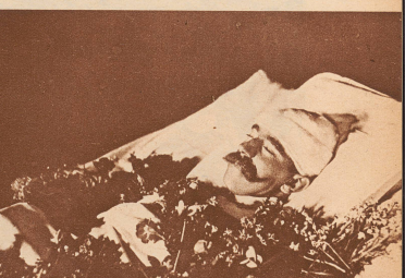
Kronprinz Rudolf auf dem Totenbett. Auf dem Jagdschloß Meyerling bei Baden in der Nähe Wiens spielte sich die bis zum heutigen Tage nie völlig aufgeklärte Tragödie ab. Rudolf war ein kluger Kopf und man hatte auf ihn bereits große Hoffnungen gesetzt.