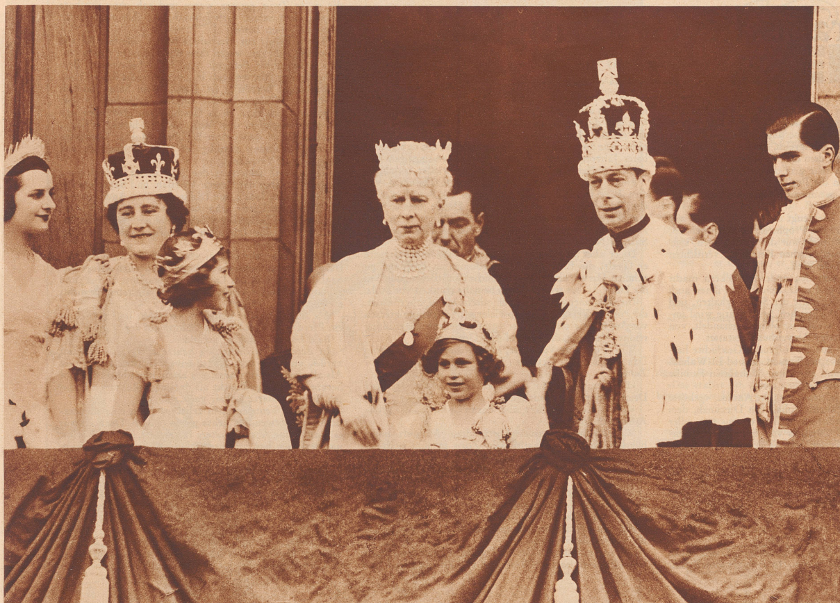
Nach der Rückkehr von der Krönung in der Westminsterabtei zeigt sich die königliche Familie auf dem Balkon des Buckingham Palastes dem Volke. Von rechts nach links: König Georg VI., die Königin-Witwe Mary, die Mutter des Königs, die Königin Elisabeth. Die beiden Kinder sind die Thronfolgerin Prinzessin Elisabeth (links) und Prinzessin Margaret Rose.

La foule réclame les souverains. Au retour de la cérémonie du Sacre, L.L. MM. le Roi Georges VI, la Reine-Mère Mary, la Reine Elisabeth et les Princesses royales Elisabeth et Margaret Rose apparaissent au balcon de Buckingham Palace.