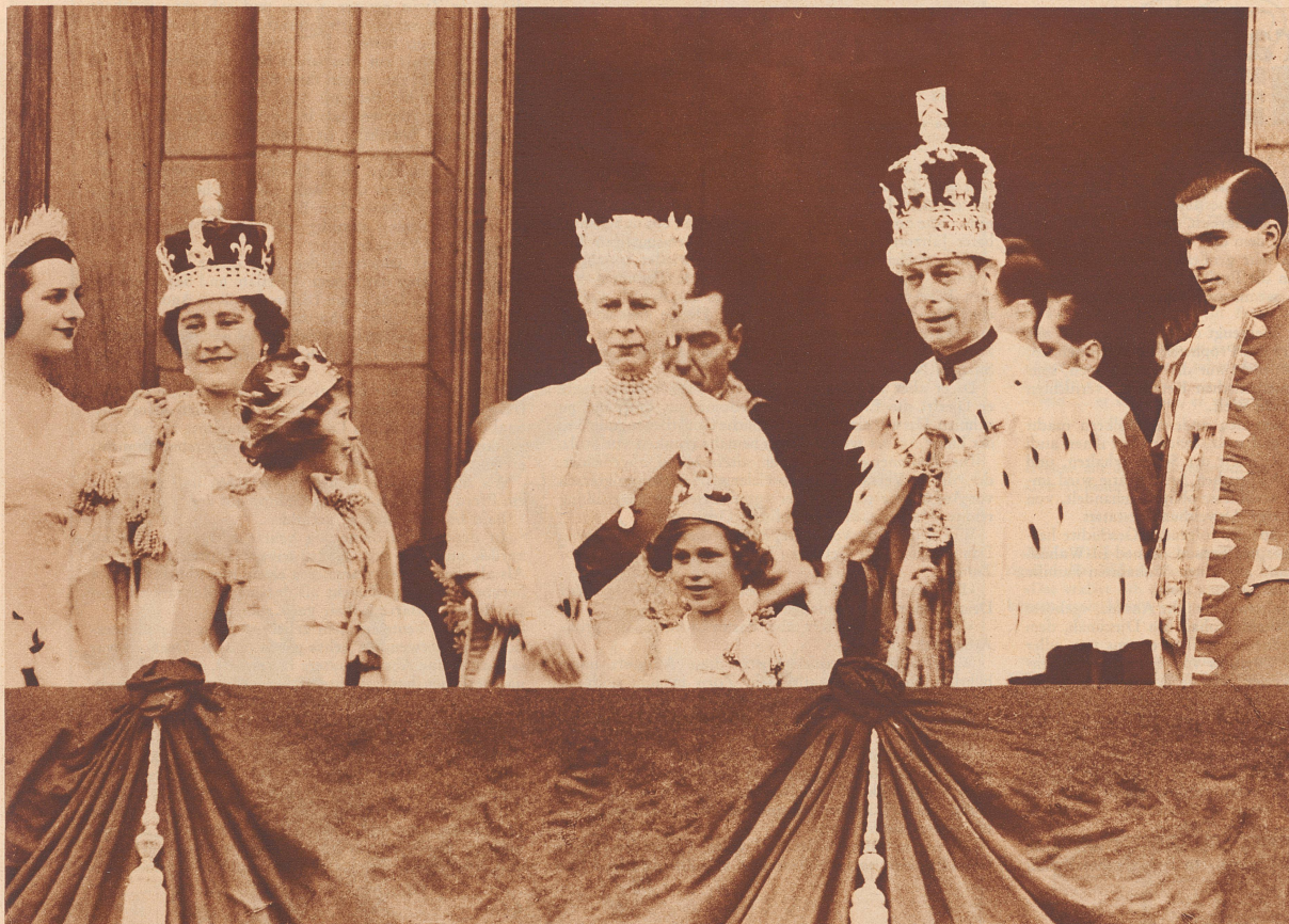
Nach der Rückkehr von der Krönung in der Westminsterabtei zeigt sich die königliche Familie auf dem Balkon des Buckingham Palastes dem Volke. Von rechts nach links: König Georg VI., die Königin-Witwe Mary, die Mutter des Königs, die Königin Elisabeth. Die beiden Kinder sind die Thronfolgerin Prinzessin Elisabeth (links) und Prinzessin Margaret Rose.