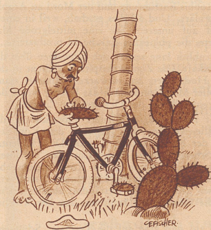
Der Fakir wechselt das Sattelkissen Le fakir change de coussin de selle