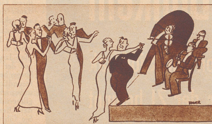
Der kleine Mann: «Ich finde die Musik einfach berauschend, mein Fräulein, könnten wir nicht immer in der Nähe des Podiums tanzen?»

— Vite! vite! cria le gamin entrant en courant chez le droguiste du village. Vite, mon père est poursuivi par un taureau! — Ciel! Que puis-je faire? s'enquit le droguiste. — Donnez-moi vite un nouveau film pour mon appareil photographique!