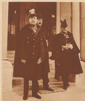
Minister José Francisco de Barros Pimentel, der neue brasilianische Gesandte in Bern. S. E. José Francisco de Barros Pimentel, le nouveau ministre du Brésil à Bern.