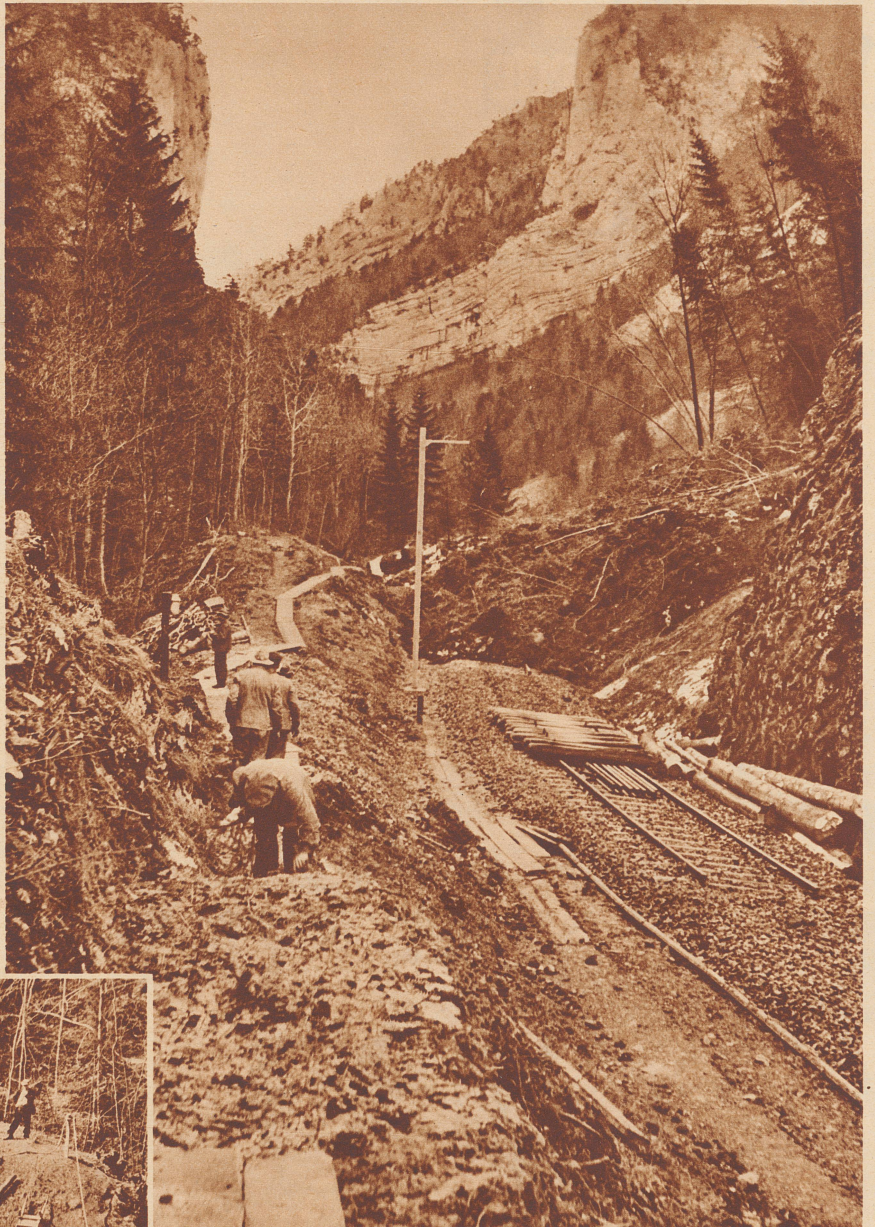
Blick in die enge Klus von Court mit einem Teil der Verheerungen des Erdrutsches. Auf eine Länge von 300 Meter ist das Bahntrasse mit mächtigen Felsblöcken, Schutt und Bäumen meterhoch verschüttet. Wo das noch möglich war, wurde in aller Eile das Geleise abmontiert.

Dans la gorge de Court. Sur une longueur de 300 mètres, la voie ferrée est obstruée par un glissement de terrain. Partout où il a été possible de le faire les rails ont été démontés.