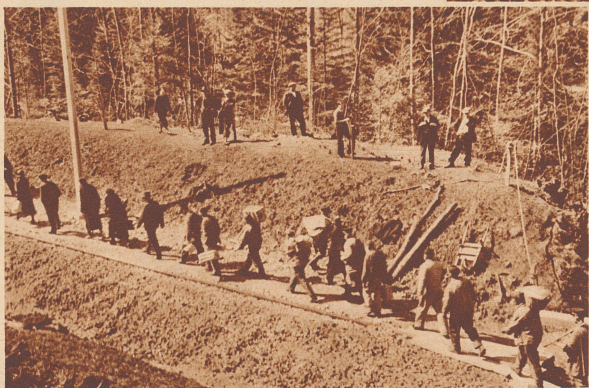
Beidseitig verkehren noch Personenzüge bis zur Unfallstelle. Dort wird der Verkehr durch Umsteigen aufrechterhalten. Ungefähr 300 Meter müssen die Reisenden zu Fuß gehen. Der Gütertransport auf der Linie aber ist ganz eingestellt.

Des deux côtés les trains continuent à fonctionner. Au lieu de la catastrophe les voyageurs doivent effectuer un trajet de 300 mètres à pied «pour prendre la correspondance». Le transport des marchandises est complètement supprimé.