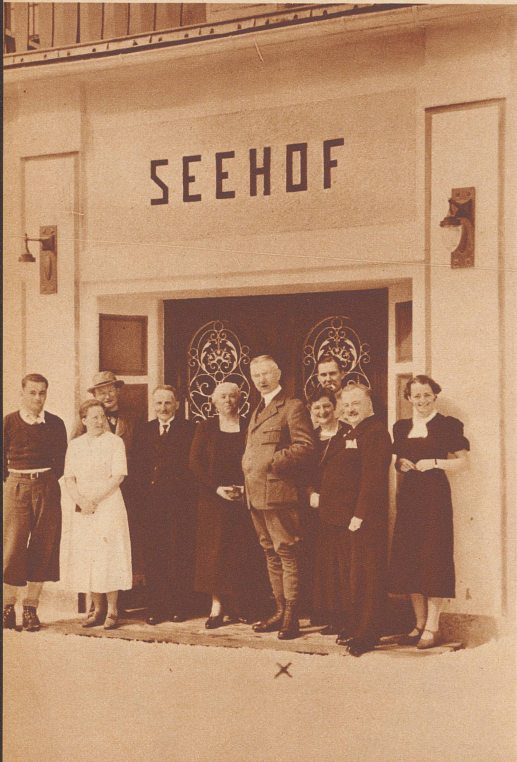
Der deutsche Reichsbankpräsident Dr. Hjalmar Schacht (X) erholt sich mit seiner Familie beim Frühlingsskifahren in Arosa.

Le président de la Reichsbank, Dr Hjalmar Schacht et sa famille passent leurs vacances de printemps à Arosa.