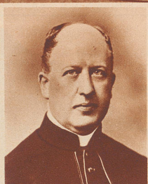
† Msgr. Dr. Emanuel Corragioni d'Orelli ursprünglich als Legationssekretär im diplomatischen Dienst der Eidgenossenschaft tätig, dann nach abgeschlossenen theologischen Studien langjähriger Kaplan der Schweizergarde im Vatikan und päpstlicher Hausprälat, starb 76 Jahre alt.

Vornehme Herrschaften in einem Sechsplätzer des glanzvollen Genfer Automobil-Salons, der zur vollkommensten Auto-Schau des Jahres geworden ist. Les connaissez-vous? ces gens chic qui siègent dans cette voiture six places du Salon de l'Automobile de Genève?