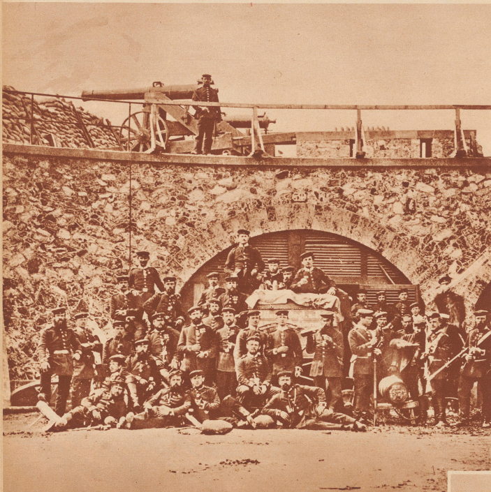
Als das Fort von Observvilliers in die Hände der Preußen fiel, war die Eroberung von Paris unvermeidlich. Bild: Abteiling eines preußischen Garderegimentes in Fort Observvilliers. Oben eine der eroberten französischen Batterien. Une compagnie prussienne d'un régiment de la Garde au fort d'Observvilliers. Ce fort était le dernier bastion de la défense de Paris.