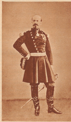
General Trochu (1815 bis 1896). Er zeichnete sich im Krimkrieg und als Divisionsgeneral bei Solferino aus. Im August 1870 wurde er Gouverneur von Paris und einen Monat später bis Ende Januar 1871 Haupt der Regierung der Nationalen Verteidigung. Während der Belagerung von Paris durch die Deutschen bewies er großes Organisationstalent. Le général Trochu (1815-1896) avait fait ses preuves dans les campagnes de Crimée et d'Italie. Nommé gouverneur de Paris, en août 1870, il était appelé un mois plus tard — après la chute de l'Empire — à la présidence du gouvernement de la Défense nationale. Il eut un remarquable organisateur durant le siège de Paris.