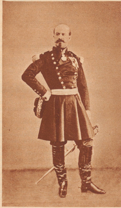
General Trochu (1815 bis 1896). Er zeichnete sich im Krimkrieg und als Divisionsgeneral bei Solferino aus. Im August 1870 wurde er Gouverneur von Paris und einen Monat später bis Ende Januar 1871 Haupt der Regierung der Nationalen Verteidigung. Während der Belagerung von Paris durch die Deutschen bewies er großes Organisations Talent. Le général Trochu (1815-1896) avait fait ses preuves dans les campagnes de Crimée et d'Italie. Nommé gouverneur de Paris, en août 1870, il était appelé un mois plus tard — après la chute de l'Empire — à la présidence du gouvernement de la Défense nationale. Il eut une remarquable organisation durant le siège de Paris.

St. Cloud, nachdem es von den Preußen beschossen und in Brand gesteckt wurde. Saint-Cloud après que les Prussiens y eussent boulé le feu.