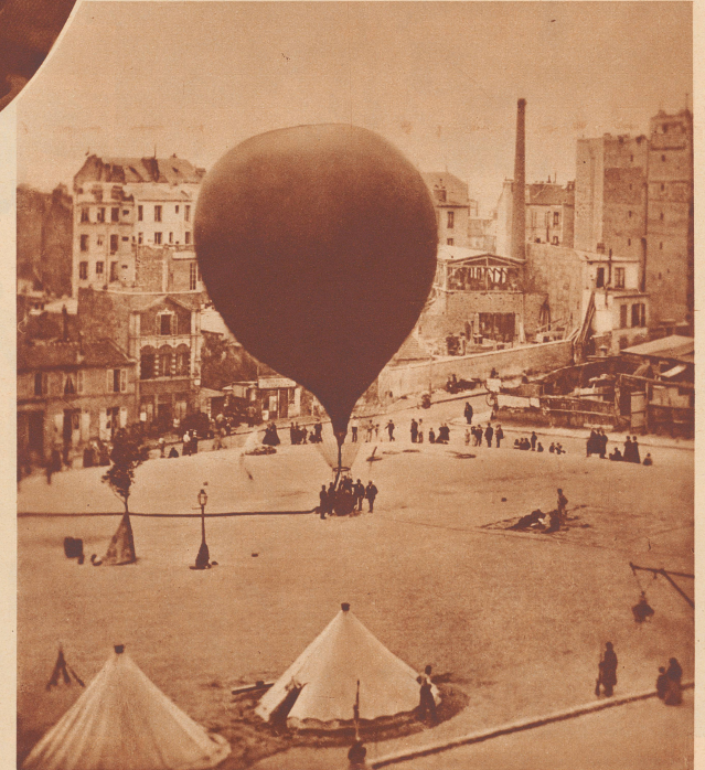
Am 6. Oktober 1870 verließ Gambetta in einem Ballon Nadars das belagerte Paris und organisierte dann von Tours aus die «levée en masse». Bild: Ein Ballon Nadars, wie ihn Gambetta benutzte, auf der Place St. Pierre (Montmartre). Le 6 octobre 1870, dans un ballon de Nadar, parti sur la place St-Pierre, à Montmartre, Gambetta quittait Paris assiégé pour Tours, où il organisa la levée en masse.

Les nouvelles de la capitulation de Sedan, de la reddition de Napoléon III à Guillaume I (2 sept. 1870) bouleversèrent la capitale. Paris était perdu. L'empire avait fait faillite. Mais la France ne désarmait pas. Deux jours plus tard, le 4 septembre, Gambetta proclamait la République à l'Hôtel de Ville. Le jour même, le nouveau gouvernement de la Défense nationale était constitué sous la présidence du général Trochu, gouverneur de Paris. Il se composait en outre de Jules Favre (Affaires étrangères), Gambetta (Intérieur), Jules Ferry, Crémieux, Arago, etc. Tandis qu'une partie du nouveau gouvernement restait à Paris pour organiser la résistance de la capitale assiégée, d'autres ministres s'envolaient — par ballon — vers Tours pour lever de nouvelles troupes. Il fallait déloger Paris. Pour répondre à l'appel de Gambetta, ce fut la levée en masse. Des armées se formèrent. Armée de la Loire sous Chancy, victorieuse à Coulmiers, puis battue à Loigny, obligée de battre en retraite vers le Mans et la Normandie; armée des Vosges qui eut son