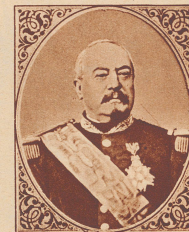
Marschall Bazaine (1811—1888). Er kämpfte im Krimkrieg und bei Solferino mit, war Oberbefehlshaber der französischen Truppen in Mexiko. Bei Ausbruch des deutsch-französischen Krieges war Bazaine Kommandeur des 3. Armeekorps und seit dem 12. August Oberbefehlshaber. Er zog sich nach der Schlacht bei Vionville auf Metz zurück, wo er eingeschlossen wurde. Die Übergabe von Metz an die Preußen am 27. Oktober 1870 wurde ihm von Gambetta als Landesverrat ausgeteilt. Drei Jahre später verurteilte ihn ein Kriegsgericht zum Tode. Mac Mahon verwandelte die Todesstrafe in 20jährige Haft, aus der er schon im Herbst 1874 nach Madrid entlassen konnte. Le Maréchal Bazaine (1811—1888) combattit en Crimée, à Solferino et fut chef du corps expéditionnaire au Mexique. Chef du 3 e Corps d'armée, puis chef suprême de l'Armée française, il fut contrainct par son incapacité et sa négligence de se réfugier dans Metz et de capituler. Sa reddition lui fut reprochée comme crime de haute trahison envers la patrie par Gambetta. Trois ans plus tard, il était condamné pour ce chef à la peine capitale par le Conseil de Guerre. Sa peine fut commuée en 20 ans de prison par Mac Mahon. En 1874, il s'évadait en Espagne où il vécut entouré du mépris général.

jour de gloire à Villersexel, mais qui, ébranlé sous Héricourt, dut se réfugier en Suisse (Bourbaki); armée du Nord, victorieuse à Bapaume et Pont-à-Mousson, évacuée à St-Quentin. L'armée de Paris qui tenait sans succès de rompre l'investissement aux journées du Bourget, de Champigny, de Buzenval, s'enferma dans la capitale, et fut finalement obligée de se rendre. Le 29 janvier 1871, Paris capitulait. Le gouvernement de la Défense nationale était contraint de poser les armes.