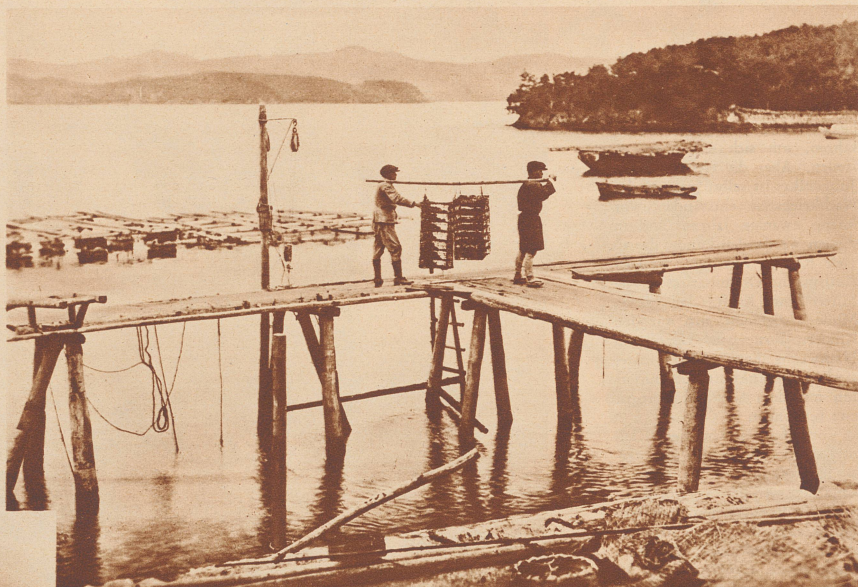
Die Käfige, in denen sich die Perlmuscheln befinden, werden alle halbe Jahre aus dem Meere gezogen, um gründlich gereinigt zu werden. Nach sieben Jahren haben sich echte Perlen in den Muscheln gebildet.

Wißt ihr, wie man echte Perlen gewinnt, die auf dem Meeresgrunde wachsen? Der französische Forschungsreisende Robert Percival hat einmal in Ceylon indische Perlenfischer bei ihrer Arbeit beobachtet. Er berichtet darüber: «Jede Barke dieser Fischer ist mit zwanzig Mann besetzt, die unter einem Kommando stehen. Zehn davon besorgen das Rudern und andere Bootsarbeiten. Die übrigen sind Taucher, die immer je fünf auf einmal in das Meer tauchen, um auf dem sechs bis acht Meter tiefen Grund die Perlenmuscheln loszureißen und nach oben zu bringen. Ihr einziges Hilfsmittel ist ein schwerer, an ein Seil gebundener Stein. Kommt die Reihe zu tauchen an einen von ihnen, so ergreift er das Seil dicht über dem Stein mit den Fußzehen, die diese Eingeborenen wie die Finger der Hand zu gebrauchen verstehen, und springt damit über Bord. Der schwere Stein zieht ihn schnellstens zu Boden. Auf dem Grunde angekommen, hält er sich