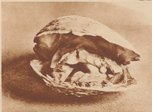
Eine aufgebrochene Perlmuschel mit drei ganzen, echten Perlen. Sie ist in einem Drahtkasten in Japan gezüchtet worden.

mit der linken Hand an dem Seil fest und reißt mit der rechten so viele Muscheln los, wie er erreichen kann. Die gewonnenen Muscheln wirft er in einen an seinem Leib befestigten Korb. Ist seine Arbeit beendet, gibt er durch Ziehen an dem Seil das Signal, ihn hochzuholen. Von Jugend auf an diese Tätigkeit gewöhnt, besitzen die indischen Perlentaucher die Fähigkeit, mehrere Minuten unter Wasser zu bleiben. Trotzdem ist die Anstrengung auch für sie fürchterlich. Vielen stürzt, wenn sie wieder an Bord kommen, das Blut aus Mund und Nase, und sie