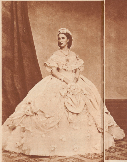
Kaiserin Charlotte von Mexiko (1840-1927). Sie war die Tochter Leopolds I., die Franzosen unter Bazaine Mexiko räumten und Maximilian im Stich nach Europa, in der vergeblichen Hoffnung, ihrem Gatten die französische Unterstützung zu sichern. Während ihres Aufenthaltes in Rom verfiel sie, erdrückt von Verzweiflung, in Irrensin. Bis zu ihrem Tode lebte sie dann in Belgien. L'Impératrice Charlotte du Mexique (1840-1927), fille du Roi des Belges. Quand les Français du général Bazaine quittèrent le Mexique, l'Empereur trouva en difficulté. L'Impératrice se rendit alors en France pour supplier de leur conserver son aide. La nouvelle de l'exécution de son époux à Rome - fut cause de sa démence, qui ne la quitta qu'avec la vie, 60 ans

von Belgien. Als ließen, fuhr sie Fille dauernd Jammer und Leopold 1er. Maximilien se Napoleon III qu'elle apprît à plus tard.