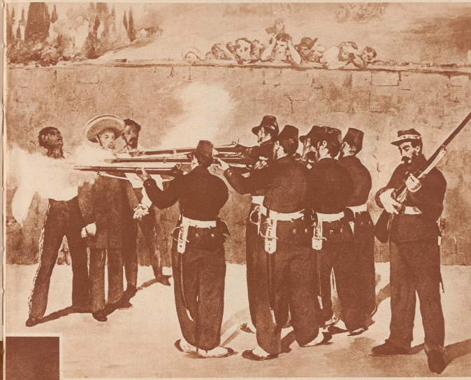
Die Erschießung Kaiser Maximilians von Mexiko am 19. Juni 1867. Links von ihm Mejia, rechts Miramon, der Gegenspieler von Juarez. Exécution de l'Empereur Maximilien et de ses derniers fidèles Mejia et Miramon, le 19 juin 1867, d'après le tableau de Manet.

von Belgien. Als ließen, fuhr sie Fille dauernd Jammer und Leopold 1er. Maximilien se Napoleon III qu'elle apprît à plus tard.