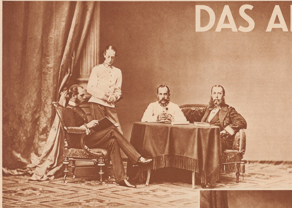
Kaiser Franz Josef mit seinen Brüdern. Von links nach rechts: Erzherzog Karl Ludwig, Erzherzog Ludwig Viktor, Kaiser Franz Josef, Erzherzog Maximilian, der spätere Kaiser von Mexiko (1832-1867). L'Empereur François-Joseph et ses frères. De gauche à droite: Les archiducs Karl-Ludwig, Ludwig-Viktor, l'Empereur François-Joseph, l'archiduc Maximilien (1832-1867) qui fut plus tard Empereur du Mexique.

Auch über Europa hinaus suchte Napoleon III. seinen Ruhm auszudehnen. Im Oktober 1860 eroberten die Franzosen gemeinsam mit den Engländern die chinesische Hauptstadt Peking. Die alten Absichten Frankreichs, sich in Hinterindien festzusetzen, ließen Napoleon 1862 den Grund zu der Kolonie Kocinchina legen. Im