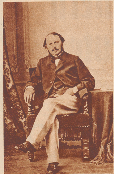
Herzog von Persigny (1808-1872)

Ueber zehntausend Verbannungsurteile vervollständigend das Ergebnis. Der Präsident, auf zehn Jahre bestellt, verfügt über alle Streitkräfte, hat das Recht, Krieg zu erklären und Frieden, Bündnisse, Staatsverträge zu schließen; er hat die Initiative zur Gesetzgebung und kann jederzeit jede