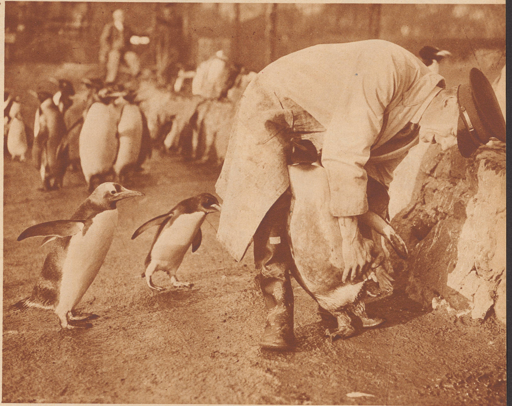
Die Pinguine im Zoo von Edinburgh haben infolge der kalten Witterung zum Teil wundte Füße bekommen. Man schickt sie nun zur Heilung täglich durch ein Lehmbad, das die nötigen Medikamente enthält. Wenn dann der Wärter sich vom Stand der Dinge durch eine gründliche Musterung überzeugen will, stehen in seiner Nähe die Zugehörigen der Pinguinfamilie in höchst Anteilgeladener Haltung.

Eugene O'Neill, der bekannte amerikanische Romanschriftsteller und Dramatiker, wurde in Würdigung seines Gesamtwerkes mit dem Nobelpreis der Literatur ausgezeichnet.