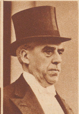
Minister Antonio Fabra Rivas der Gesandte Spaniens.