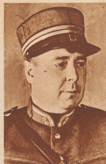
Dr. Eduard Denzler Oberstleutnant der Sanitätstruppen, ist vom Bundesrat an Stelle des zurückgetretenen Oberst H. Sutter zum Chefarzt des Schweizerischen Roten Kreuzes gewählt worden.

Gleichzeitig mit der Elektrifizierung der Pilatusbahn wird auch die Station Pilatuskum neu gebaut. Während 48 Betriebsjahren hat die alte Station auf der luftigen Höhe ihren Dienst getan. Jetzt ist unter dem Einfluß der Witterung manches morsch geworden und mußte erneuert werden. Die neue Station Pilatuskum, ein einfacher Zweckbau, ist am 3. November vollendet worden. Bild : Der obere Teil der Station im Rohbau, mit dem Werkplatz im Vordergrund, nach den schweren Schneefällen Ende September.