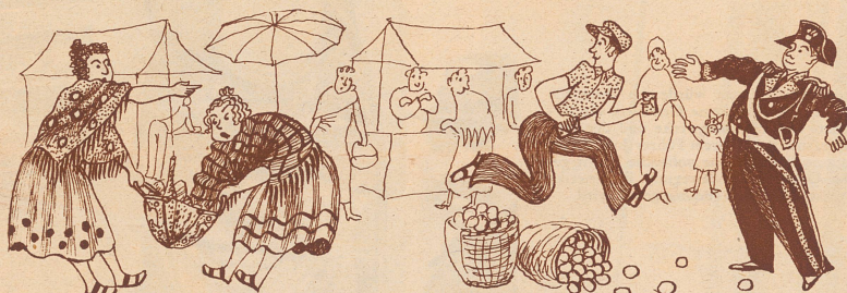
4. Plötzlich merkten sie, daß ihre Geldtaschen gestohlen worden waren. Zum Glück lief der Dieb in die offenen Arme eines Poliziotto.