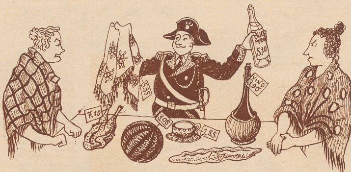
7. In der Markttasche war kein Geld, aber der Poliziotto sagte: «Signore, es kommt mir vor, als wollte sich eine von Ihnen auf Kosten der anderen oder des Diebes bereichern; denn nach dem, was ich sehe, kann von den 40 Lire nicht viel übrig sein. Wollen Sie mir nun sagen, wer welche Einkäufe gemacht hat, damit ich Ihnen alles vorrechne und die Börsen richtig aushändige?» — «Nein!», sagten die beiden; «mit einem, der uns Unehrlichkeiten zumutet, reden wir nicht!» — «Signore, ich bitte um Entschuldigung!», sagte der Poliziotto. «Aber Sie brauchen mir gar nichts zu verraten, ich finde mich schon zurecht.» Es gelang ihm an Hand der angehefteten Preiszettel zu ermitteln, wieviel Geld in der anderen Börse eigentlich sein sollte und wem sie gehörte. — Liebe Kinder, das machte er in zwei Minuten! Euch lassen wir eine Woche Zeit dazu.