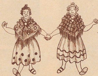
1. Signora Bullo und Signora Belli gingen auf den Markt.

Geschichte für junge Rechner und deren Eltern