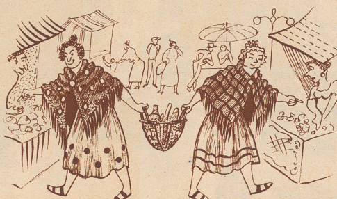
3. Dann besorgten sie ihre Einkäufe und legten die Geldtaschen auch in die Markttasche.