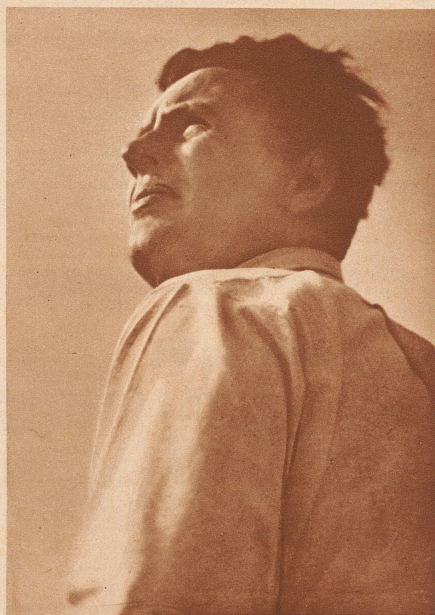
Dr. A. WANDER A.-G., BERN

Winterkälte → nasse Füße → Erkältung → Schnupfen → Influenza → Contra-Schmerz