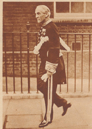
† Sir Godfrey Collins