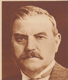
† Sir Arnold Theiler

langjähriger Direktor der tierärztlichen Forschungsinstitute der Südafrikanischen Union in Pretoria, ein aus Luzern gebürtiger Auslandschweizer mit ganz großen Verdiensten und erfolgreicher Forscher, starb 70jährig auf einer Europareise in London. Professor Theiler war Ehrenmitglied einer Reihe gelehrter Gesellschaften.