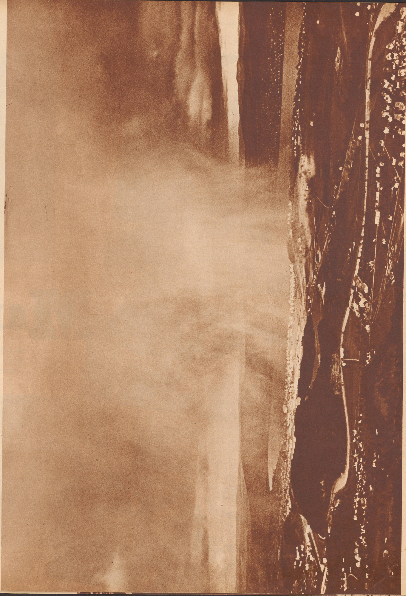
Gewitter über Zürich