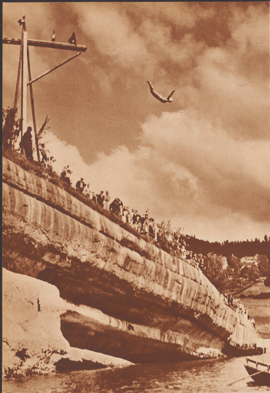
Aus 40 Meter Höhe in den Doubs ein Rekordsprung, ausgeführt von dem jurassischen Schwimmer und Taucher Armand Girard in Les Brenets.