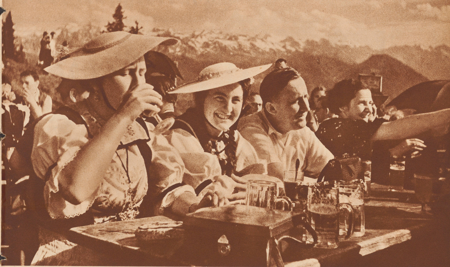
Auf der Rigi