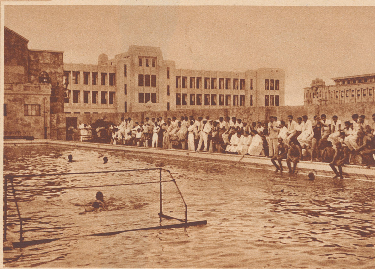
Wasserballmatch im mächtigen Bassin des Stadions von Manila. Das angeschnittene Haus rechts ist die aus dem Jahre 1601 stammende Santo Tomas-Universität, der moderne Bau in der Mitte ist die große Sporthalle.

Der Sieger rapportiert seinem Lehrer. Der rechts außen sitzende Priester ist der ehemalige Schwimmmeister des Colleges und heutige Trainer der Universitätsmannschaft von Manila.