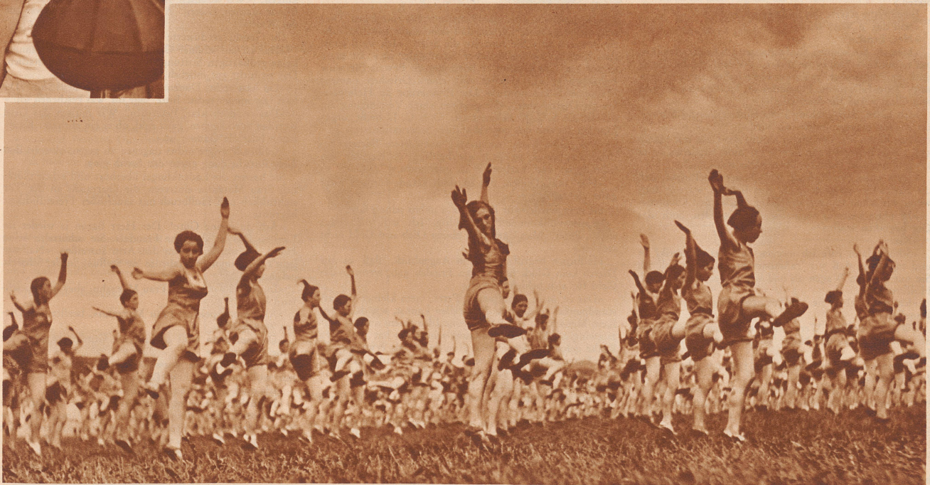
Zum erstenmal wurden die allgemeinen Übungen im Walzerhythmus ( \frac{3}{4} Takte) durchgeführt. Der Versuch bewährte sich: das rhythmisch Be-schwingte, leicht Tänzerische entspricht dem natürlichen Bewegungsverlangen des menschlichen Körpers besser als die frühere mehr starre Turnweise.