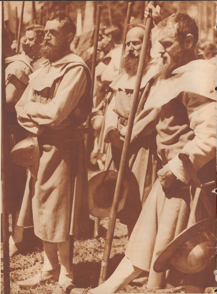
Der Harst der Obwaldner in ihren roten Röcken und weißen Kapuzen, bewaffnet mit der Halbarte, war eine der schönsten Gruppen im historischen Festzug.