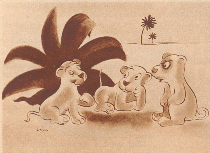
Unter jungen Löwen.