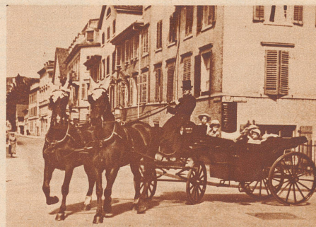
Des Herrn Garagebesitzers Protestfahrt.

Die «Optimisten» in Zürich ließen sich ihren Reklameumzug nicht nehmen. Eine Parade schöner Autos gehörte dazu, still und bescheiden schlichen sie sich, am Faden geführt, hinter zwei «Haber-motoren» her durch die sonntäglichen Straßen.