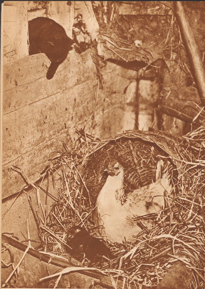
Stiefmutter Henne hütet die beiden Jungen der Katzenmutter «Milred». Die Katze kehrt gerade von einem Ausflug zurück und löst die Henne in der alten Zeine ab.