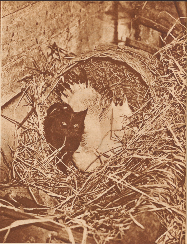
Manchmal sitzen auch Mutter Katze und Stiefmutter Henne friedlich beisammen in der Zeine und hüten die beiden Kätzchen.