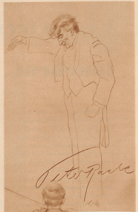
Dr. Peter Raabe Präsident der Reichsmusikkammer und Musikschritsteller.