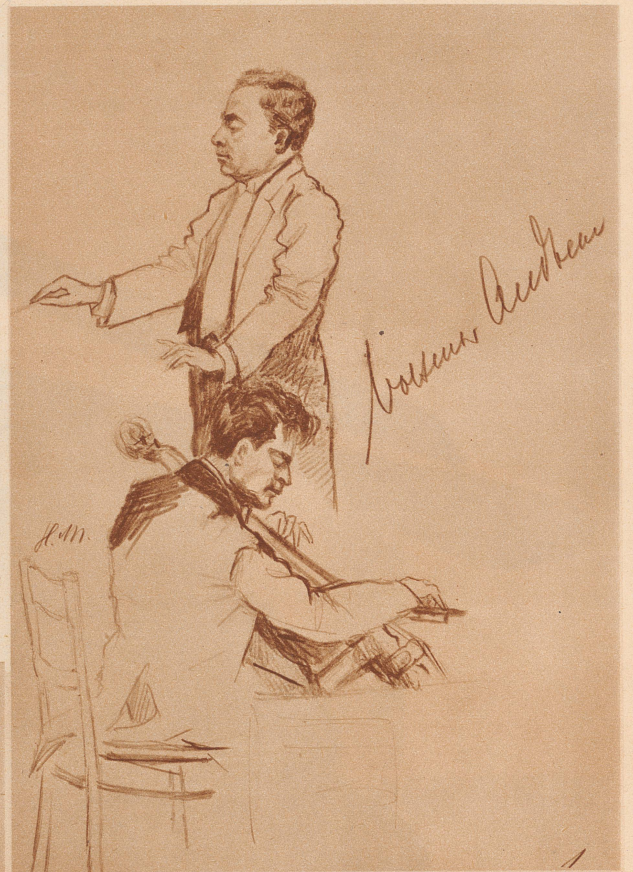
Dr. Volkmar Andreae Leiter des Tonhalleorchesters, Dirigent des Gemischten Chores Zürich und Direktor des Zürcher Konservatoriums für Musik.