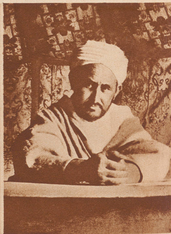
Abd el Krim

der ehemalige König von Annam. In mehr als hundertjähriger Eroberungszeit hat sich Frankreich in Hinterindien ein großes Kolonialreich geschaffen. Annam ist ein Teil davon. 1883 anerkannte Annam die Schutzherrschaft Frankreichs. An der Spitze des Staates blieb formell der König stehen. Während des Weltkrieges aber konspirierte Bun Lam, der 1889, kaum zehnjährig, den Thron bestiegen hatte, mit den Deutschen. Darum wurde er seines Thrones entsetzt und 1915 nach Réunion gebracht. Hier lebt er nun mit seinen zwei mongolischen Frauen und 23 Kindern, bezieht vom französischen Staat eine Jahresrente von 40 000 Franken und betreibt in der Hauptstadt St-Denis ein Photoatelier.