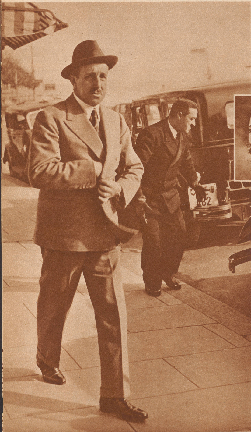
Der königliche Globetrotter

Exkönig Alfons XIII. von Spanien wurde vergangenen 17. Mai 50 Jahre alt. Von diesen 50 Lebensjahren saß er 45 Jahre (1886—1931) auf dem spanischen Thron; denn: als er noch nicht geboren war, starb am 25. November 1885 sein Vater Alfons XII. Sofort nach seiner Geburt wurde der Säugling Alfons zum König proklamiert. Bis zu seiner Volljährigkeit, die er 1902 erreichte, regierte für ihn seine kluge Mutter Maria Christine. 1906, zwanzigjährig, heiratete er die 19jährige Prinzessin Ena von Battenberg. Die Revolution von 1931 verwandelte die spanische Monarchie in eine Republik. Alfons mußte mit seiner Familie das Land verlassen. Er zog nach Frankreich und mietete sich im Schlosse Fontainebleau ein. Seither jagt er wie ein rasender Reporter durch in der Festloge der Pariser Oper, segelt auf den bayerischen Seen, ist Zuschauer beim Derby von Epsom, nimmt teil an der Fronleichnamprozession in Rom, ist zu Gast an diesen und jenen Königshöfen, verheiratet seine Söhne und Töchter — nur in seine Heimat Spanien darf er nicht zurückkehren. Unser Bild zeigt Alfons XIII. bei einem Besuch in Genf, wo er vergangenen Herbst als Zuschauer einer Sitzung der Völkerbundsversammlung beiwohnte.