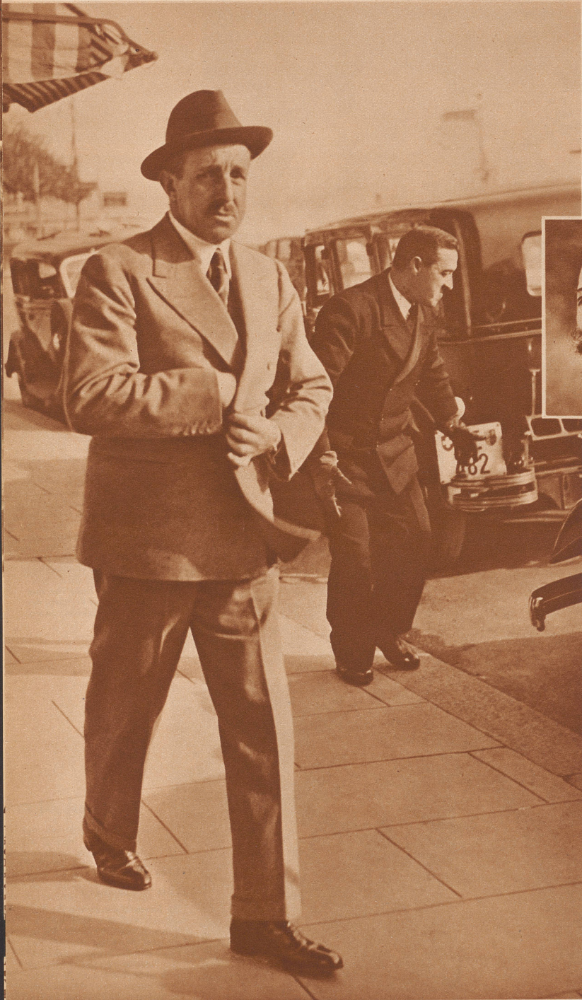
Der königliche Globetrotter

Exkönig Alfons XIII. von Spanien wurde vergangenen 17. Mai 50 Jahre alt. Von diesen 50 Lebensjahren saß er 45 Jahre (1886—1931) auf dem spanischen Thron; denn: als er noch nicht geboren war, starb am 25. November 1885 sein Vater Alfons XII. Sofort nach seiner Geburt wurde der Säugling Alfons zum König proklamiert. Bis zu seiner Volljährigkeit, die er 1902 erreichte, regierte für ihn seine kluge Mutter Maria Christine. 1906, zwanzigjährig, heiratete er die 19jährige Prinzessin Ena von Battenberg. Die Revolution von 1931 verwandelte die spanische Monarchie in eine Republik. Alfons mußte mit seiner Familie das Land verlassen. Er zog nach Frankreich und mietete sich im Schlosse Fontainebleau ein. Seither jagt er wie ein rasender Reporter durch in der Festloge der Pariser Oper, segelt auf den bayerischen Seen, ist Zuschauer beim Derby von Epsom, nimmt teil an der Fronleichnamprozession in Rom, ist zu Gast an diesen und italienische Grafen und kubanische Plantagenbesitzer — nur in seine Heimat Spanien darf er nicht zurückkehren. Unser Bild zeigt Alfons XIII. bei einem Besuch in Genf, wo er vergangenen Herbst als Zuschauer einer Sitzung der Völkerbundsversammlung beiwohnte.