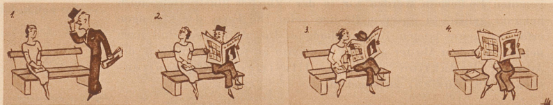
Es ist immer gut, die «Zürcher Illustrierte» mit sich zu haben.

Fritzchen bekommt seinen ersten Maßanzug. «Soll ich die Schultern wattieren, kleiner Mann?» fragt der Schneider. «Nein», sagt Fritzchen, «wattieren Sie lieber die Hosen!»