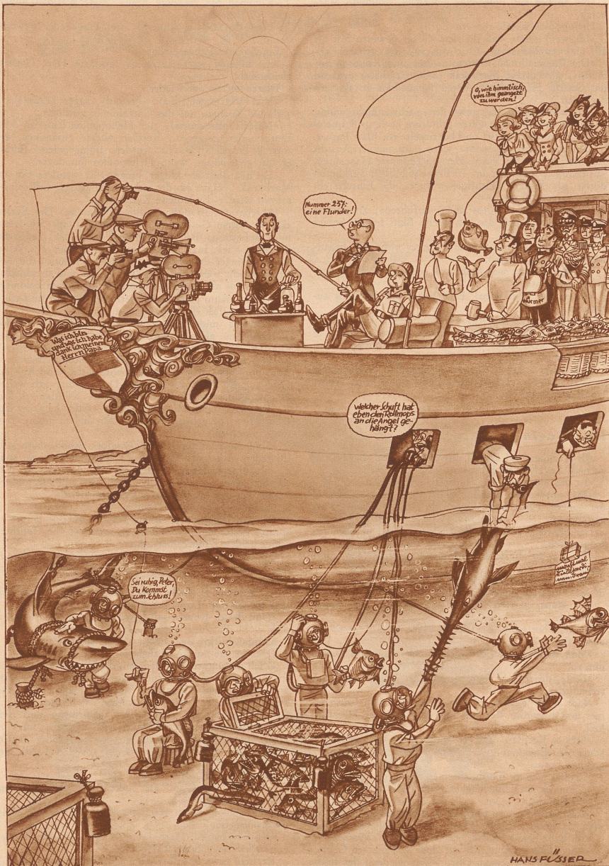
Seine Durchlaucht geruht mit Erfolg zu angeln.