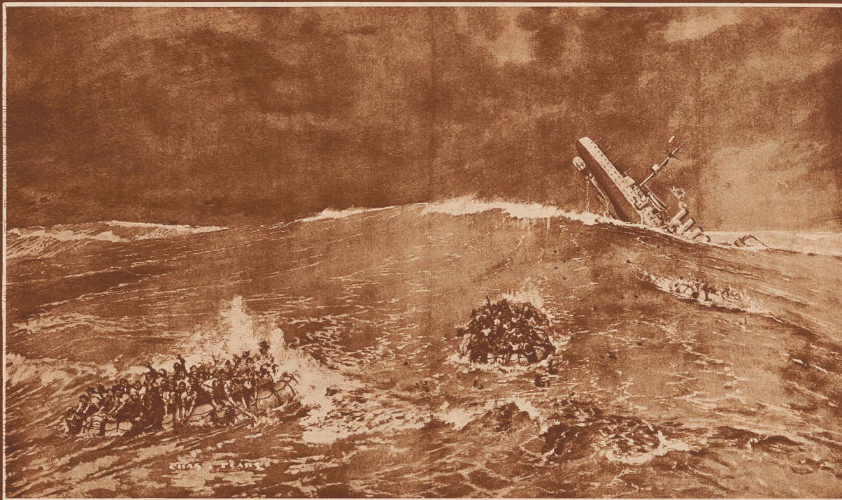
Der Untergang des englischen Panzerkreuzers «Hampshire» am 5. Juni 1916. An diesem Tage war das 11 000 Tonnen große Kriegsschiff mit Lord Kitchener und seinem Stab an Bord in Scapa Flow, dem britischen Kriegshafen in der Orkney-Inselgruppe, zur Fahrt nach Rußland ausgelaufen. Die Reiseroute war vorgezeichnet: nördlicher Kurs bis zum Nordkap, dann östlich bis Archangelsk im Weißen Meer. Von dort sollte Kitchener die Fahrt bis Petrograd zu Land fortsetzen. Vormittags 9 Uhr verließ die «Hampshire» Scapa Flow. Nach wenigen Stunden Fahrt schon stieß das Schiff westlich der Orkney-Inseln auf eine Mine, die vom deutschen Unterseeboot «U 75» ausgelegt worden war. Der Panzerkreuzer war so schwer leck, daß er nach einer halben Stunde sank. Ein kleiner Teil der Besatzung konnte sich mit Gummibooten über Wasser halten, bis ein Rettungsschiff auf der Unfallstelle eintraf. Lord Kitchener und sein Stab fanden den Tod.