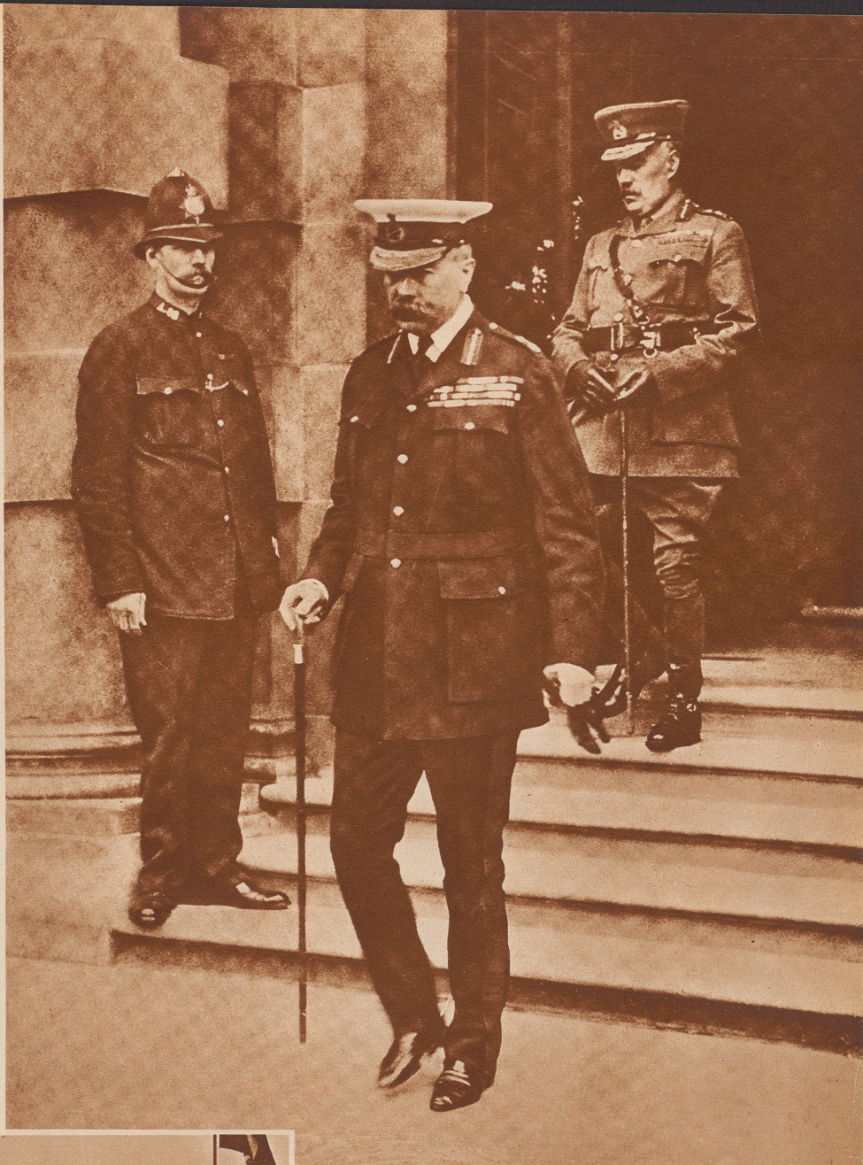
Die letzte Aufnahme Lord Kitcheners vor seinem Tode. Das Bild zeigt ihn beim Verlassen des Kriegsministeriums am 2. Juni 1916, wo er in einer großangelegten Rede vor einer Anzahl Kritikern seine Politik rechtfertigte. Zwei Tage später reiste er nach Scapa Flow ab, drei Tage später war er schon tot. 66 Jahre alt wurde er, der größte Kolonialoffizier, den Britannien jemals besessen hat. — Horatio Herbert Kitchener wurde 1850 in Bally Langford in der irischen Grafschaft Kerry geboren. 1870 kämpfte er als Freiwilliger gegen die Deutschen. 1871 trat er als Leutnant in das Ingenieurkorps ein. 1879—1880 war er Vizekonsul in Erzerum. 1882—84 nahm er an der Nilexpedition als Generalquartiermeister teil, wurde dann Gouverneur von Suakin und erhielt 1892 den Oberbefehl über die ägyptischen Truppen. Mit diesen Truppen schlug er 1898 die Derwische am Atbara und die Mahdisten. 1899 wurde er Generalstabschef der Armee Roberts im Burenkrieg. 1902 bis 1909 weilte er als Reorganisator der britischen Truppen in Indien, 1909 wurde er zum Feldmarschall, 1910 zum Mitglied des Reichsverteidigungsausschusses ernannt. 1911 bis 1914, in kritischer Zeit, war er Generalkonsul in Aegypten. Am 6. August 1914 übernahm er die Leitung des Kriegsministeriums. Am 5. Juni 1916 ging er mit der «Hampshire» unter