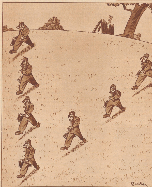
Die Macht der Gewohnheit

Die Piloten der Flugzeugstaffel 13 gehen ins Weekend.