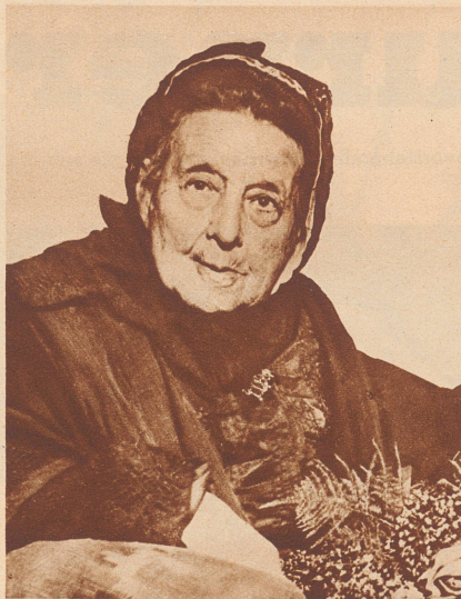
† Marianne Hainisch