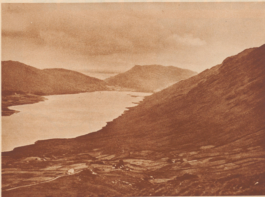
Zwischen kahlen, steilen Hängen liegen unter schwerem Gewölbe tiefe Seen. Auch bei bedecktem Himmel scheinen sie blau. Es ist eine einsame Landschaft, fernab von Eisenbahn und Auto. In ihren Tälern lebt noch das Märchen.