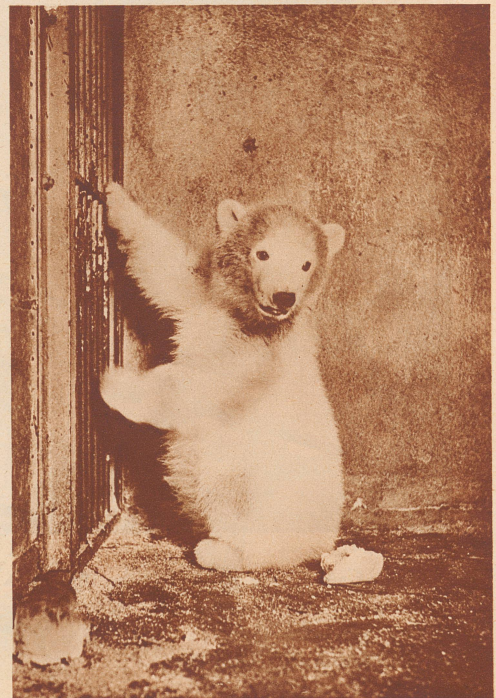
Das junge Eisbärli. Es ist jetzt vier Monate alt und hat etwa die Größe eines ausgewachsenen, fetten Dachses erreicht.