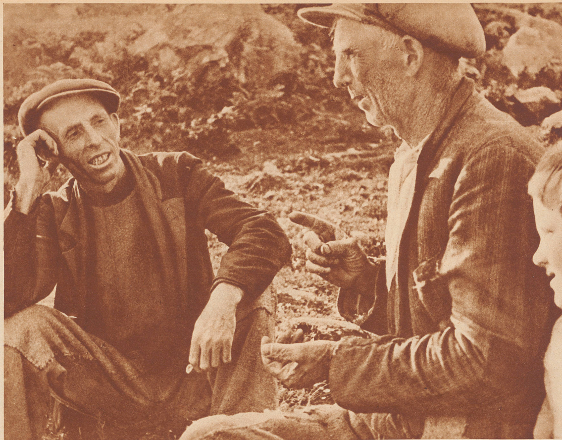
Der Märchenerzähler berichtet seinen gespannt lauschenden Zuhörern vom Helden Ketacht, der da warb um die Hand der Tochter des Königs von Griechenland.